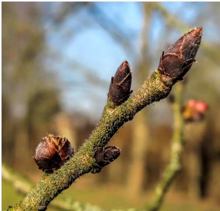
Blüten- und Blattknospen einer Ulme

Dieses Seminar wird am 17. / 18. März wiederholt. (FS16-4)