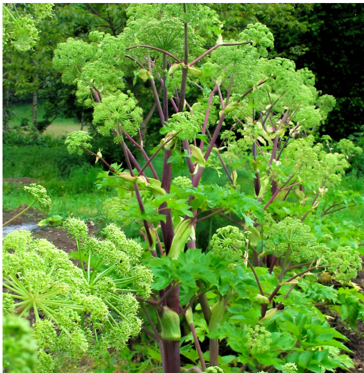
Erzengelelwurz – Angelica archangelica

Mit Hilfe einer geführten Pflanzenbetrachtung und -wahrnehmung wollen wir ihrem beeindruckenden Wesen begegnen und uns ihre Heilkraft erschließen. Damit führt dieses Seminar gleichzeitig auch in methodische Möglichkeiten der Pflanzenwahrnehmung ein.