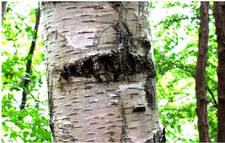
Betulin in der weißen Birkenrinde

Einführend werden traditionell verwendete und neu entdeckte Heilpflanzen für die Haut besprochen und mit Studien zu ihrer Wirksamkeit unterlegt. Hierbei wird vertiefend auf Heilpflanzen eingegangen, die ein einzigartiges Potential in der Prävention von hellem Hautkrebs (Birke und Färberwau), bei Neurodermitis, chronischen Wunden (Johanniskraut, Koriander, Süßholz) und Erythemen (Blutwurz) besitzen. Neben dem Einsatz auf der Haut wird auch auf den systemischen Einsatz über die Ernährung eingegangen. Im praktischen Teil werden äußerlich anwendbare Arzneimittel wie z.B. Korianderdgel hergestellt.